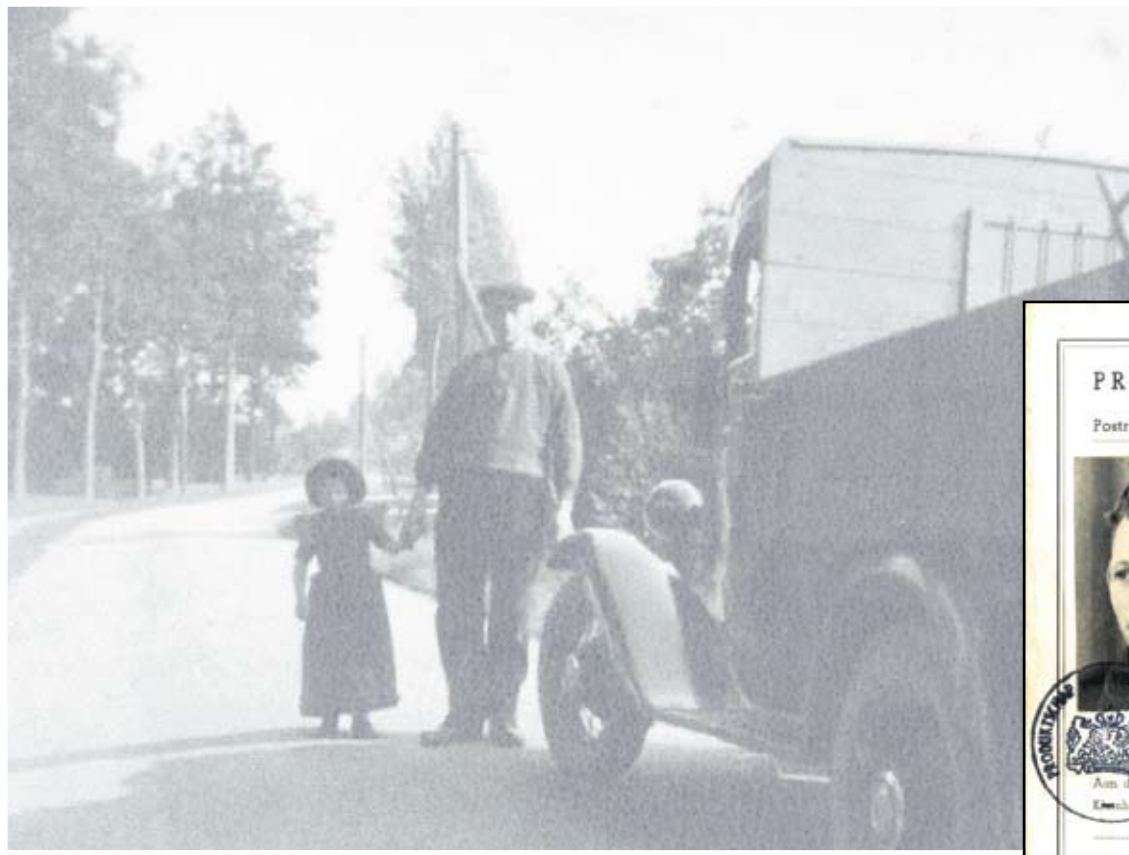
Foto links: de eerste generatie Van Diermen's, hier opa Van Diermen naast een voor die tijd zeldzame verschijning: de vrachtwagen waarmee vis werd gevent. Foto uit 1938.